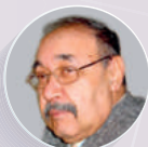
CLOVIS-GILLES FAKI VICE-PRÉSIDENT HONORAIRE