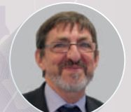
JEAN-LOUIS DEROUSSEN CONSEILLER SPÉCIAL DU PRÉSIDENT